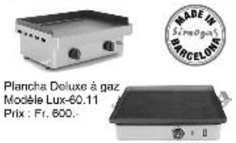
Plancha Deluxe à gaz Modèle Lux-60.11 Prix : Fr. 600.-