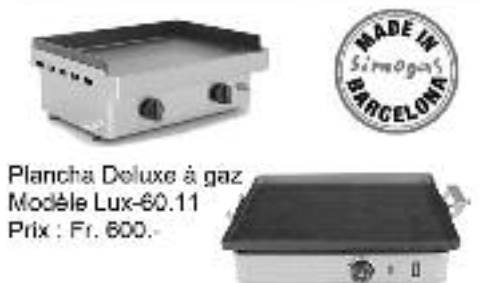
Plancha Deluxe à gaz Modèle Lux-60.11 Prix : Fr. 600.-