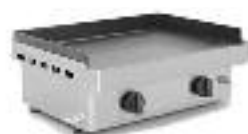
Plancha Deluxe à gaz Modèle Lux-60.11 Prix : Fr. 600.-