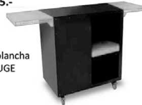
CHARIOT pour plancha RAINBOW ROUGE CHF 340.-